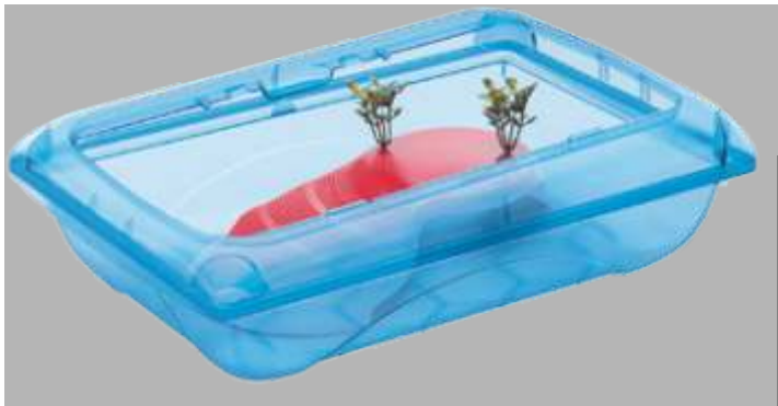
2.4.887 Tortuguera Atlantis (46,5x31x12,8cm)