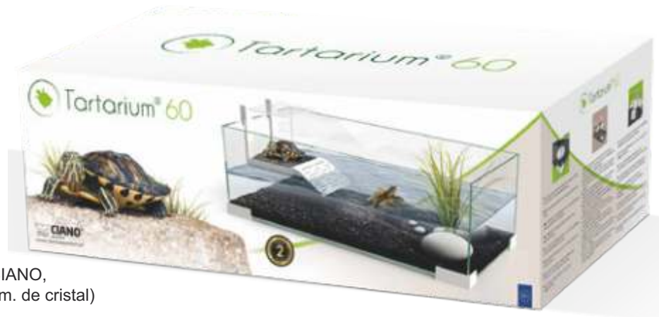
2.4.502 Tortuguera 40 Plus CIANO, 40 x 20 x 19 cm. (3 mm. de cristal)