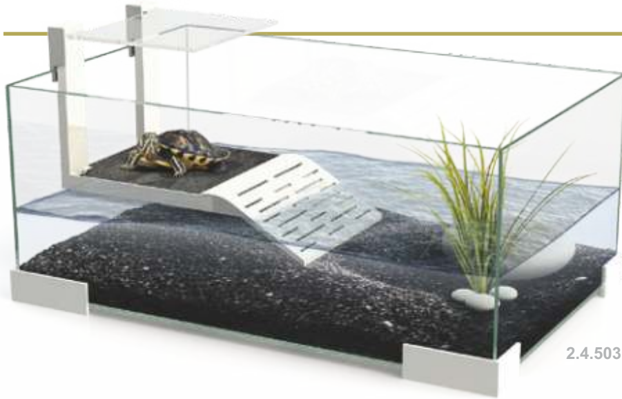
2.4.503 Tortuguera 60 Plus CIANO, 60 x 30 x 20 cm. (4 mm. de cristal)