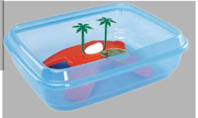
2.4.888 Tortuguera Ninja (50x40x15cm)