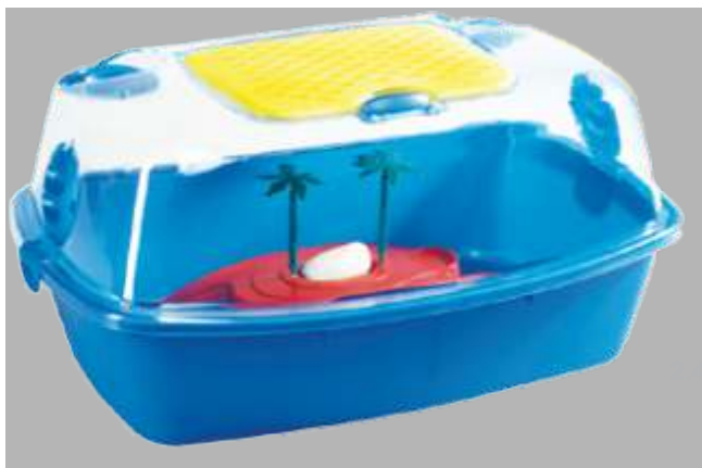
2.4.889 Tortuguera Dafne Beach (50x40x26cm)