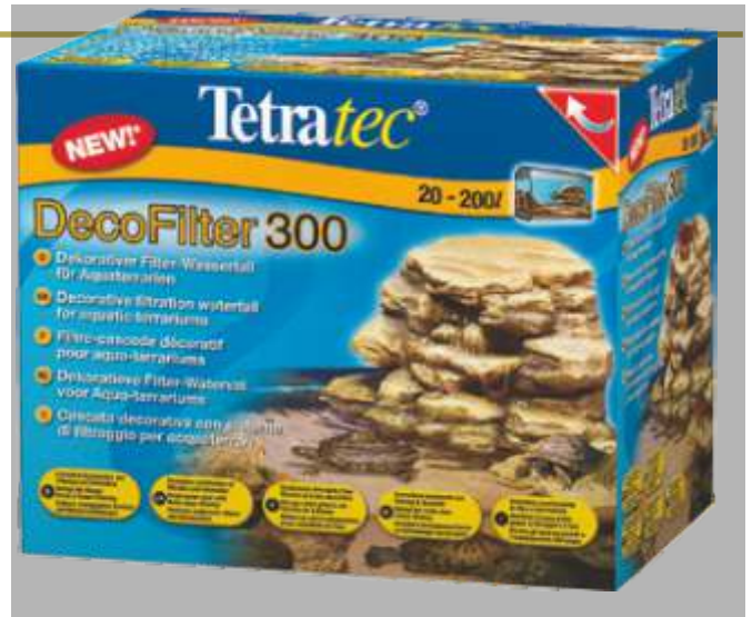
2.3.206 Deco Filter 300

Innovadora combinación de filtrado y decoración para acuaterrarios de 20 a 200 litros