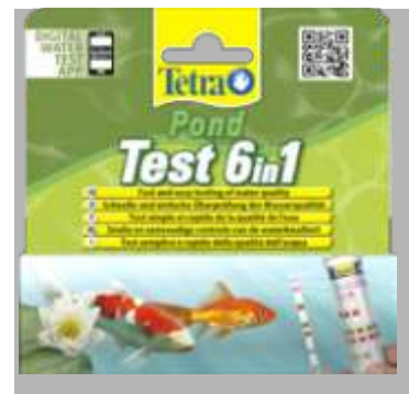
1.4.225 Tetra Pond test 5 en 1