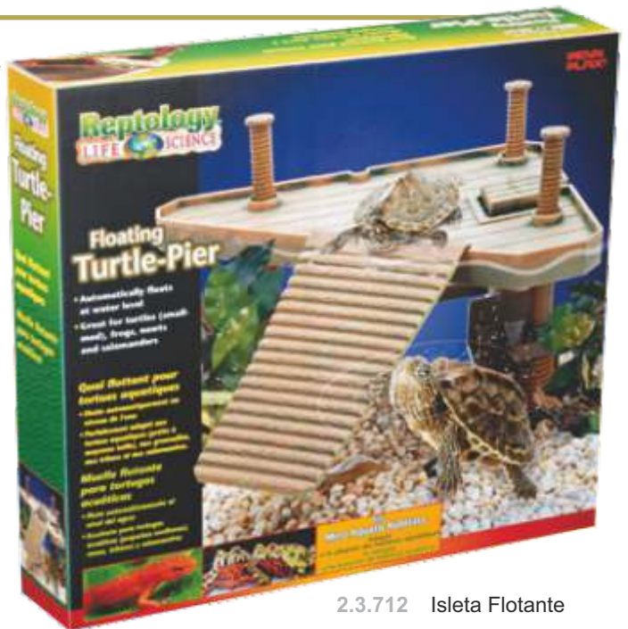
2.3.712 Isleta Flotante