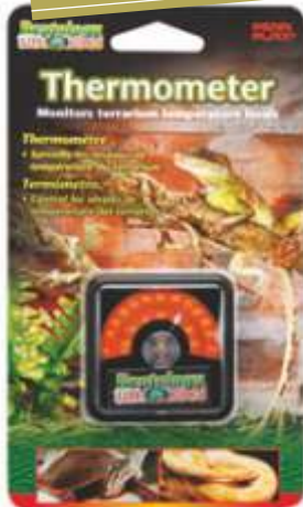
2.3.706 Termómetro Reptology