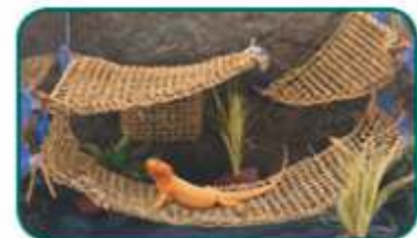
2.3.713 Hamaca esquina Terrario 27x32