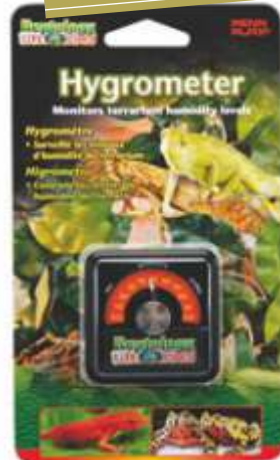
2.3.707 Higrómetro Reptology