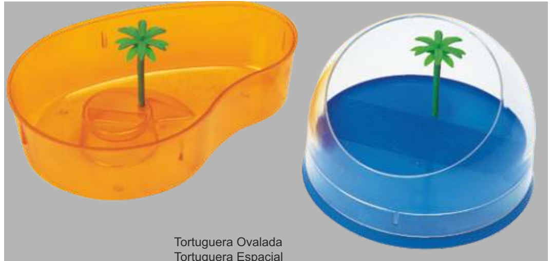
Tortuguera Ovalada Tortuguera Espacial